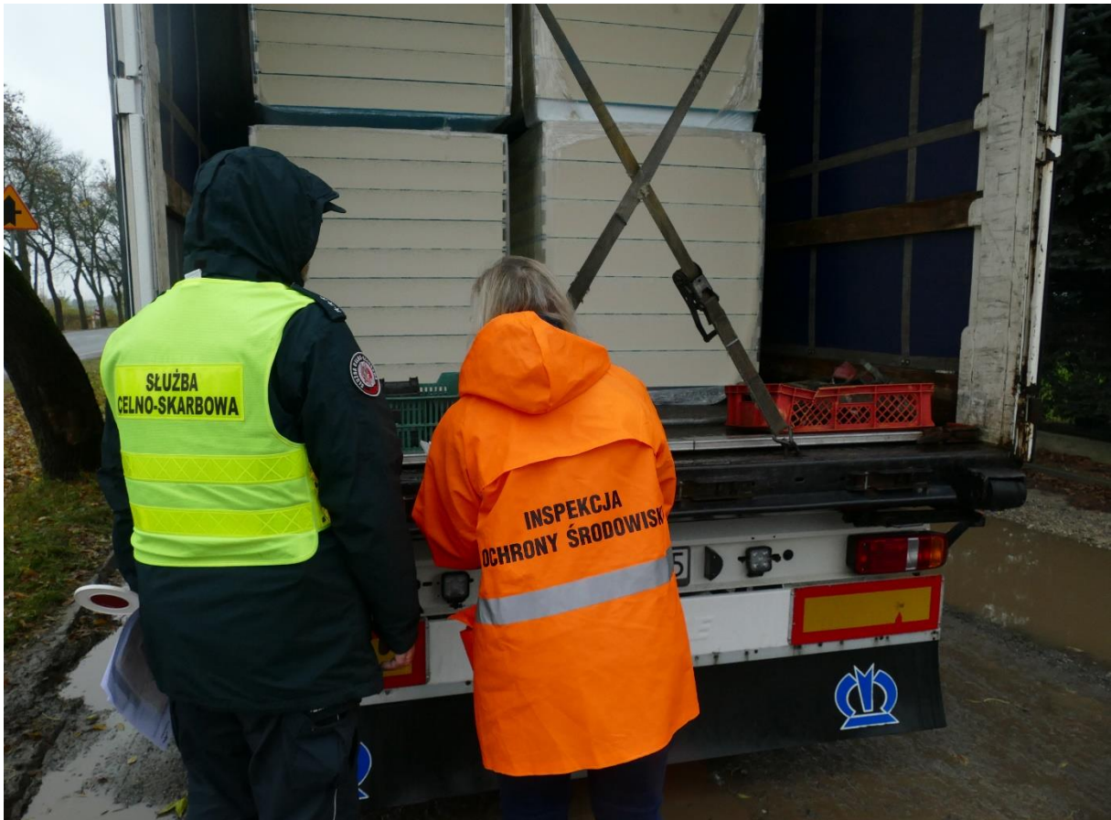
Fot.1. Wspólne działania WIOŚ w Łodzi KAS w ramach drogowych akcji kontrolnych