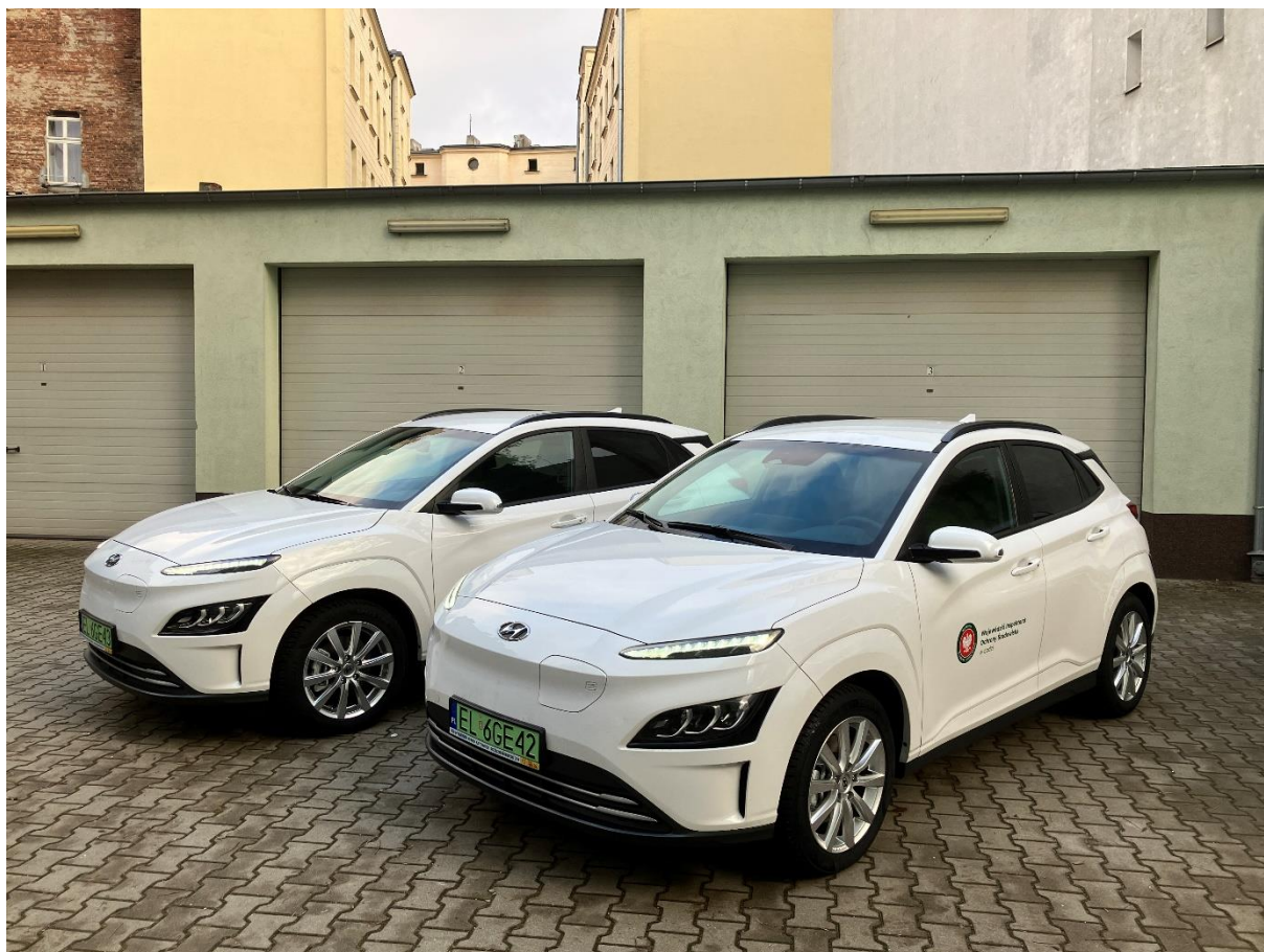
Fot. 6. Nowe samochody elektryczne