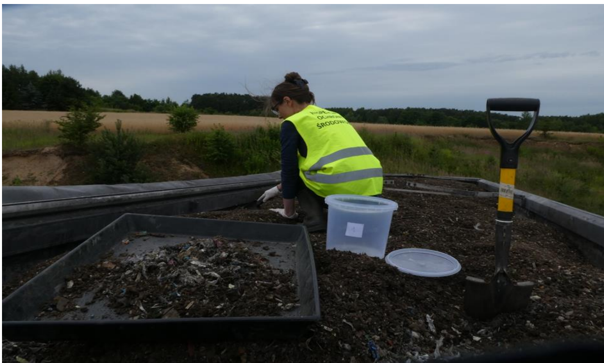
Fot.5. Czynności przeprowadzone na podstawie art. 10b ust. 2 ustawy z dnia 20 lipca 1991 r. o Inspekcji Ochrony Środowiska, na terenie wyrobiska poeksploatacyjnego „Łaznowska Wola IX” Łaznowska Wola, gm. Rokiciny (06.07.2023 r.)

W 2023 roku Łódzki Wojewódzki Inspektor Ochrony Środowiska nie zawierał porozumień z innymi organami i służbami w zakresie zwalczania przestępczości środowiskowej, natomiast prowadzono i kontynuowano wspólne działania w zakresie porozumień zawartych w latach poprzednich.