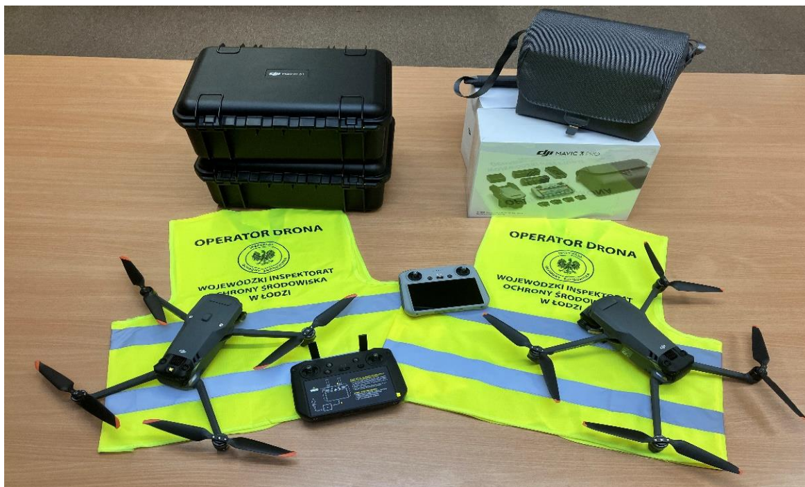
Fot. 7. Drony