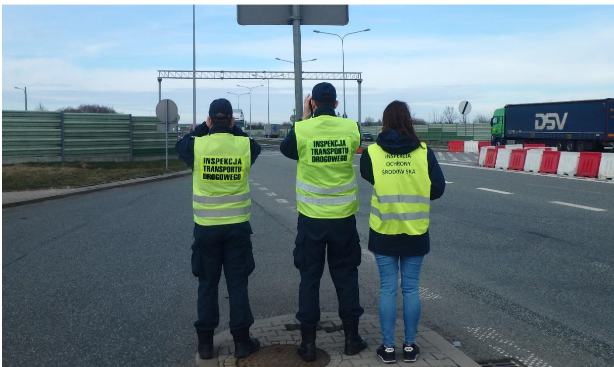
Fot.2. Wspólne działania WIOŚ w Łodzi z ITD w ramach drogowych akcji kontrolnych