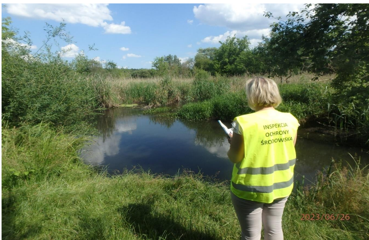
Fot.4. Kontrola rzeki Rawka, w związku z wystąpieniem zjawiska śnięcia ryb (26 czerwca 2023 r. Gmina Nowy Kawęczyn)