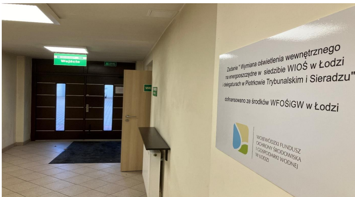
Fot. 8. Nowe oświetlenie w siedzibie WIOŚ w Łodzi