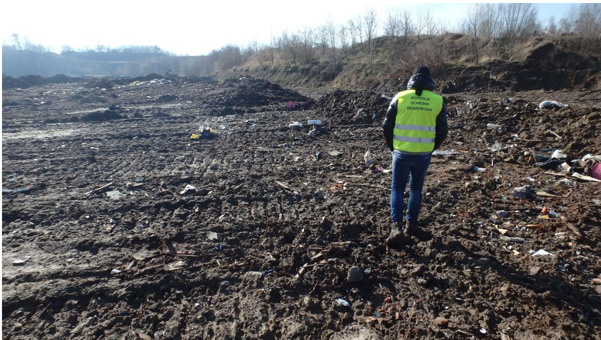
Fot.3. Ujawnienie nielegalnego deponowania odpadów w wyrobisku poeksploatacyjnym (13.04.2023 r., Łódź)